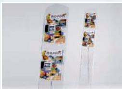
PORTE REVUE SUR PIEDS