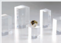
BLOC BAGUE poli diamant

Découvrez toute la gamme sur : approplex.com