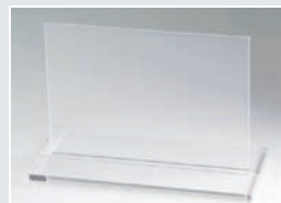
PORTE VISUEL DE COMPTOIR socle poli diamant