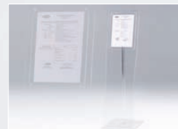
PUPITRE D'INFORMATION format A4 portrait