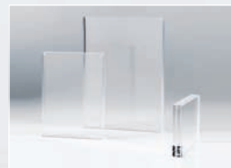
PORTE VISUEL poli diamant