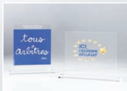
PORTE VISUEL visuel sérigraphie